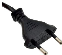
Klasse 2 stikprop