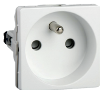
Stikkontakt med pinjord (fransk/belgisk)