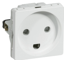
Normal dansk stikkontakt

DS 60884-2-D1 indeholder bestemmelser for tre hovedtyper: stikkontakter med bøsningstik (normale danske stikkontakt), stikkontakter med pinjord (fransk/belgisk) og stikkontakter med sidejord (Schuko). Alle inkl. tilsvarende stikpropper.