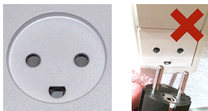
Typisk dansk stikkontakt med jord

Desværre kan stikpropper med sidebensjord ikke overføre jordforbindelsen fra danske stikkontakter med jord.