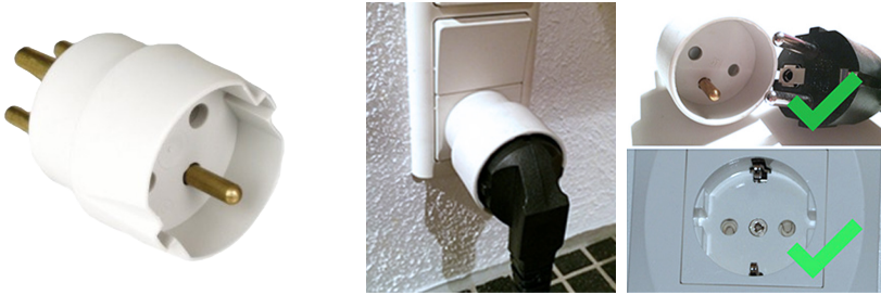
Adapter (forsats) til overførsel af jordforbindelsen og løsninger der sikrer overførelsen af jordforbindelsen

Du kan også udskifte eksisterende stikkontakter i eksempelvis i køkkenet eller bryggeret til stikkontakter med sidejord. Så behøver du ikke længere at bruge en adapter eller udskifte stikproppen for at have styr på jordforbindelsen.