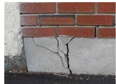
Revne i sokkel og murværk, hvor det skønnes at skyldes sætninger af hele hjørnet.