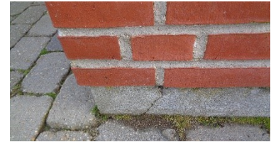
Revne i sokkel pga. forskellige bevægelser mellem sokkel og facade.