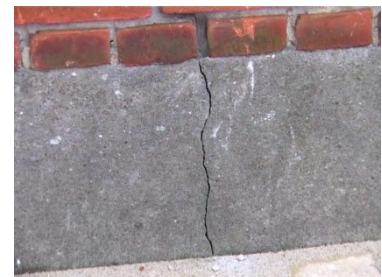
Revne vurderes at skyldes udtørring i sokkel.