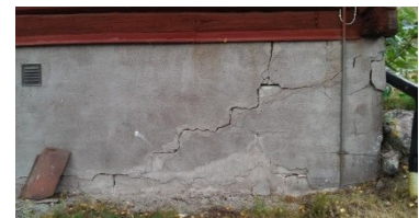
Revnemønsteret indikerer, at der er sætninger i den murede sokkel. Revnetykkelsen varierer fra top til bund.