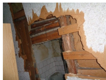
Væg af celotexplader