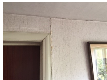
Revne i celotexplade, der er opsat direkte på indvendig muret væg. Typisk er pladerne sømmet fast.