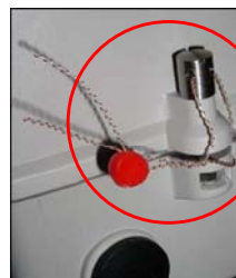
e) Installations plomberinger (2 typer)

Figur 1. Plombering og forsegling af SITRANS FUE380 systemet. Type vist i a-d benyttes ved legal plombering og forsegling i forbindelse med verifikation. Type vist i e benyttes til plombering af systemet hos slutbrugeren.