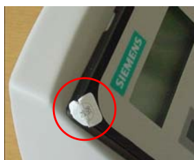
a) Plombering af transmitter

Verifikationsplombering udføres på som vist i figur 1.