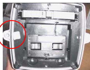
b) Plombering af transmitter