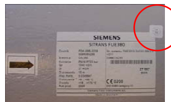
d) Legal forsegling af sensor