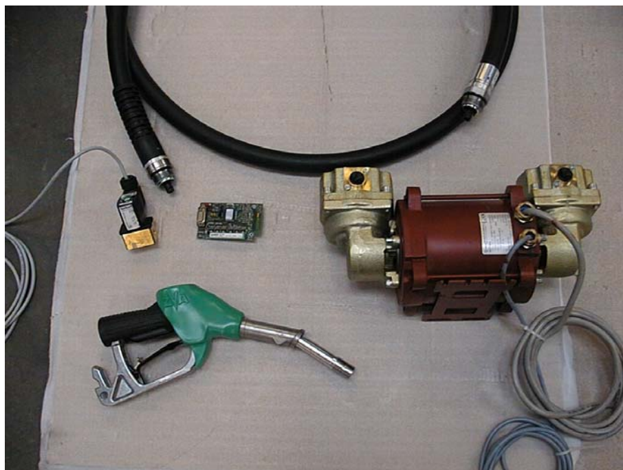
Pistol Elaflex ZVA 200 GR med gassuger 92, slange med slangeadapter, styrekort Bürkert, proportional-ventil Bürkert.